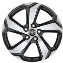
18" szürke, csiszolt felületű könnyűfém keréktárcsa (5 küllős) Alapfelszereltség a Dynamic modellváltozaton