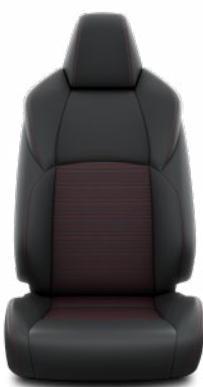
Fekete bőrhatású Alapfelszereltség a Selection modellváltozaton