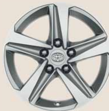
16" ezüst színű könnyűfém keréktárcsák