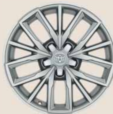
17" ezüst színű könnyűfém keréktárcsák (5 tripla küllős)