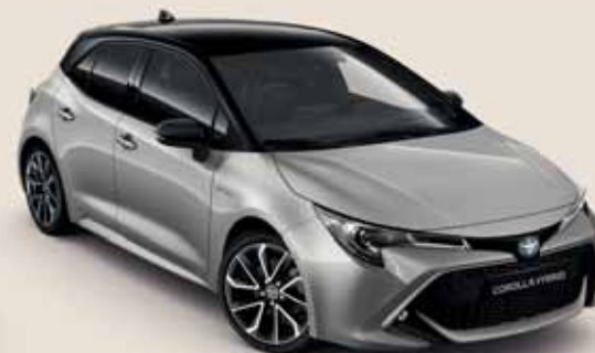
2RD Krómezüst § / Éjfekete §