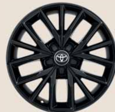
17" fekete könnyűfém keréktárcsák (5 tripla küllős)