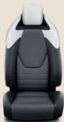
Fekete/szürke szövet, bőr betétekkel & fekete díszítés Alapfelszereltség: Executive