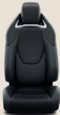
Fekete, perforált bőr & fényes króm díszítéssel tartozékként rendelhető: Executive