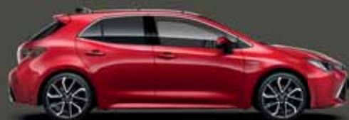
3U5 Érzéki vörös §