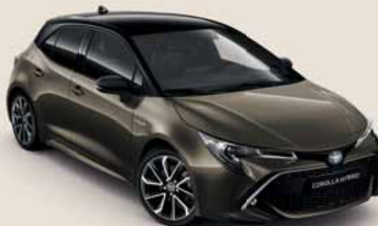
2RF Barnászöld § / Éjfekete §