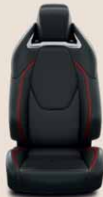
Fekete, perforált bőr vörös betétekkel & fényes króm díszítéssel tartozékként rendelhető: Executive