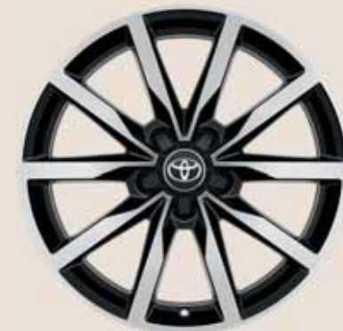
18" fekete csiszolt hatású könnyűfém keréktárcsák (5 dupla küllős)