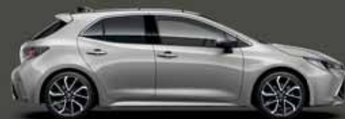
1J6 Krómezüst §