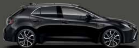
209 Éjfekete §