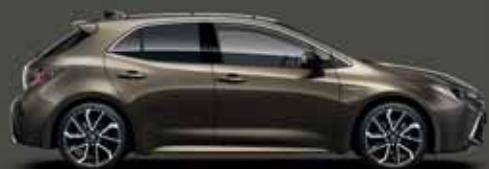
6X1 Barnászöld §