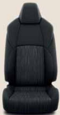
Fekete szövet Alapfelszereltség: Active