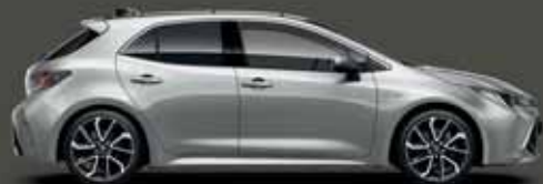
1F7 Ultraezüst §