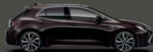
4W9 Kávébarna §