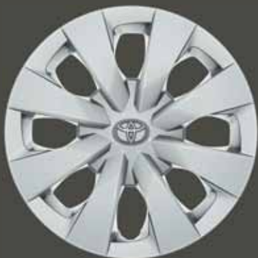
15" acél keréktárcsák dísz tárcsával (6 dupla küllős) Alapfelszereltség: Active