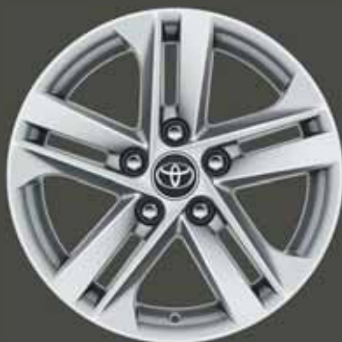
16" könnyűfém keréktárcsák (5 dupla küllős) Alapfelszereltség: Comfort