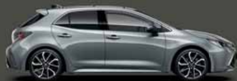
1H5 Manhattan szürke §