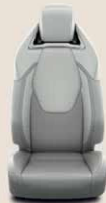
Szürke, perforált bőr & fényes króm díszítéssel tartozékként rendelhető: Executive