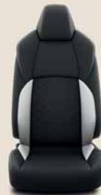
Fekete/szürke steppelt szövet, szürke varrással Alapfelszereltség: Comfort