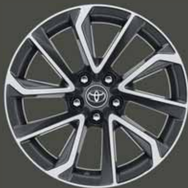
18" kéttónusú, szürke csiszolt hatású könnyűfém keréktárcsák (5 dupla küllős) Alapfelszereltség: Selection és VIP csomag