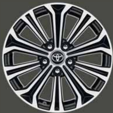
17" fekete csiszolt hatású könnyűfém keréktárcsák (10 küllős) Alapfelszereltség: Executive és Style csomag