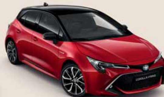
2SZ Érzéki vörös § / Éjfekete §