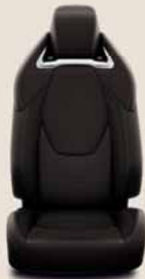
Barna, perforált bőr & fényes króm díszítéssel tartozékként rendelhető: Executive