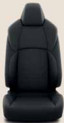
Fekete, steppelt szövet, szürke varrással Alapfelszereltség: Comfort