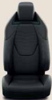
Fekete szövet, bőr betétekkel, piros varrással & fekete díszítéssel Alapfelszereltség: Selection, Executive