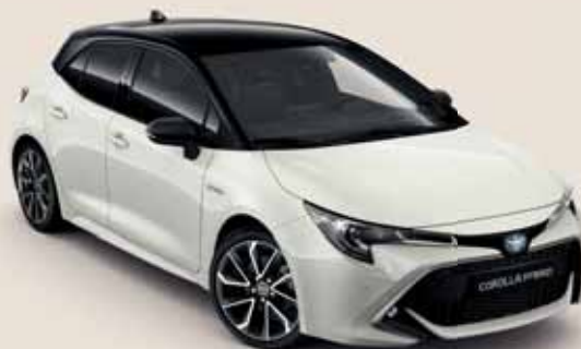
2KR Gyöngyfehér* / Éjfekete §