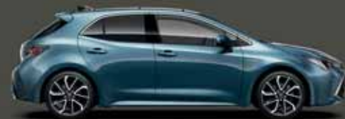
8U6 Acélkék §