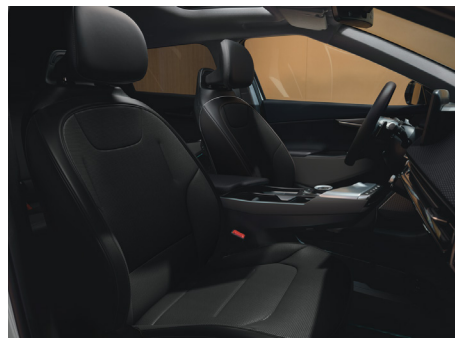
EARTH Vegánbőr ülésárpit (Bazaltfekete - WK)