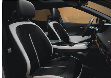
GT-LINE Suede / Vegánbőr ülésárpit (Bazaltfekete / Törtszürke - WK)