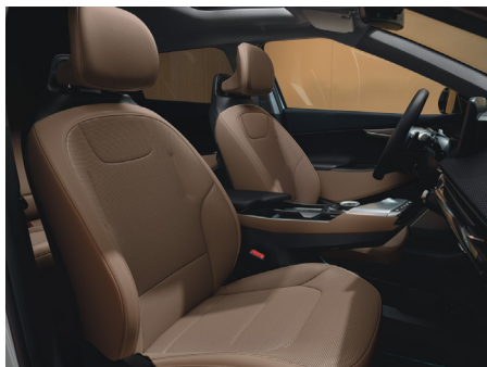
EARTH Vegánbőr ülésárpit (Lattebarna - CRJ)