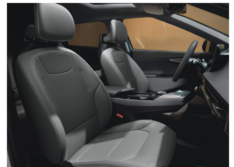
EARTH Vegánbőr ülésárpit (Törtszürke - DFS)