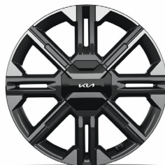
EARTH 20" keréktárcsa (UJ) opció