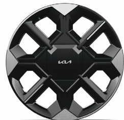
GT-LINE 20" keréktárcsa (VE)