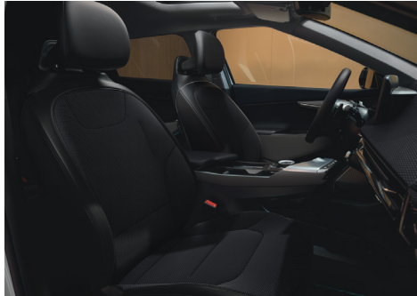
AIR Szövet / Vegánbőr ülésárpit (Bazaltfekete - WK)