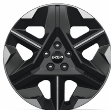
AIR / EARTH 19" keréktárcsa (XM)