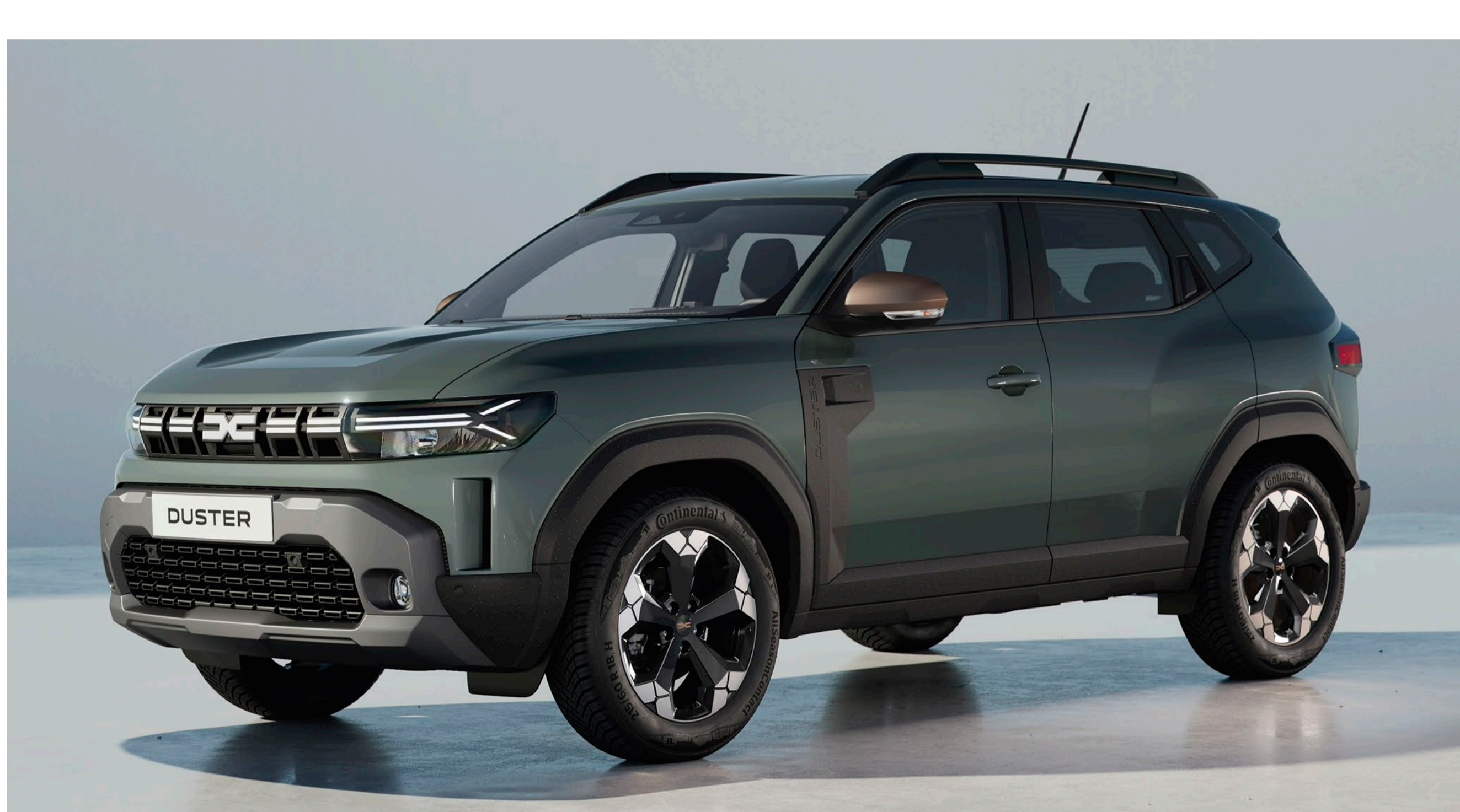
ZUZMÓ SZÜRKE (2)