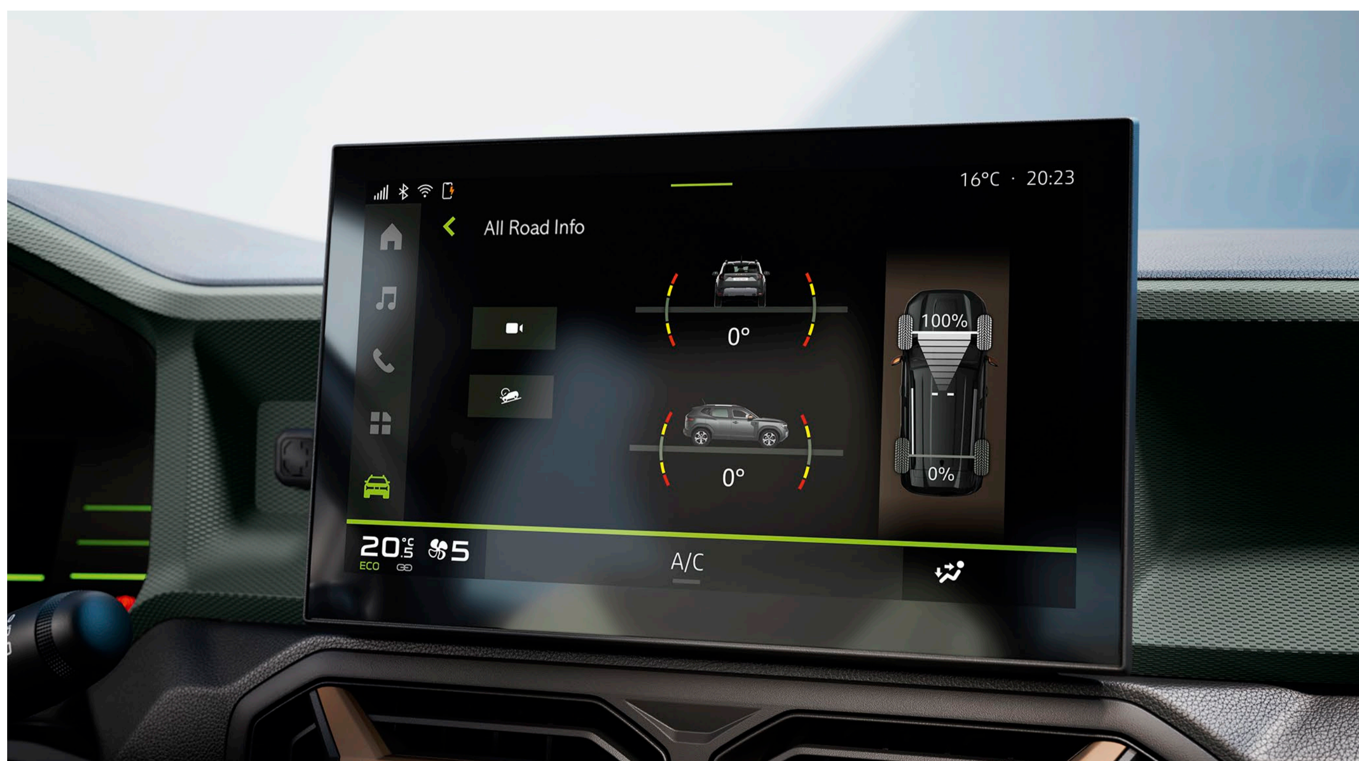
All Road Info a 4x4-es verziókon

A 4x4-es változatban elérhető új vezetési mód választóval a vadiúj Duster lehetővé teszi, hogy minden helyzettel gyorsan megbirkózzon! Megnövelt, 217 mm-es hasmagasságával és 31°-os első terepszögével a 4X4 változatok tökéletesek az emelkedők megmászásához, illetve a Starkle® karcolásgátló anyaggal a vadiúj Duster kiváló terepjáró képességekkel is büszkélkedhet, miközben megőrzi SUV megjelenését.