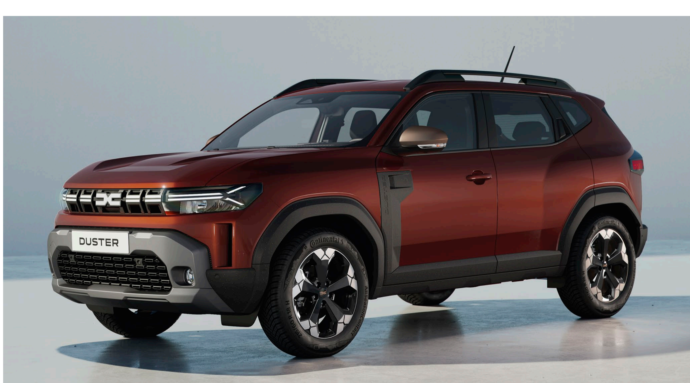
TERRAKOTTA BARNA (1)(3)