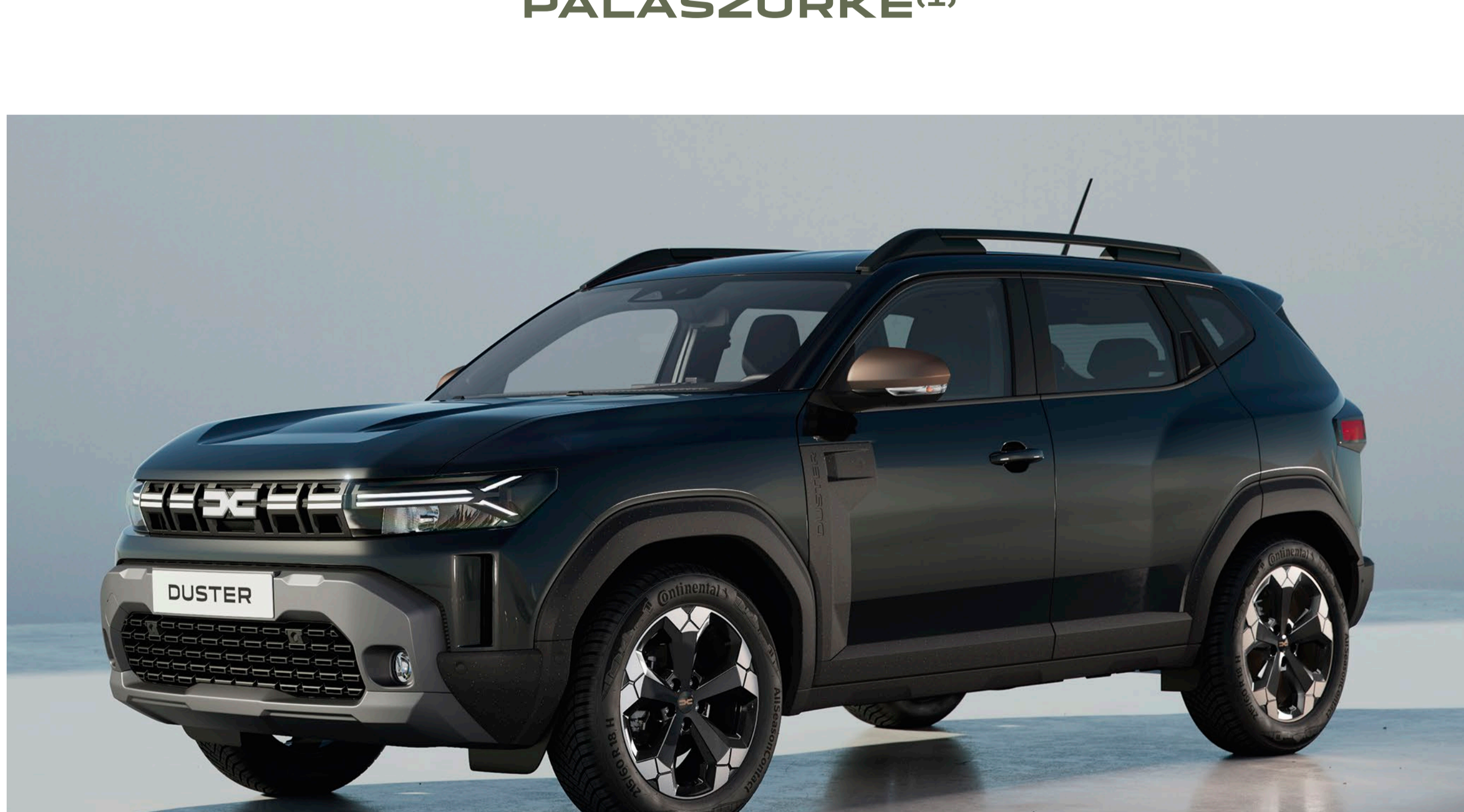
FEKETE GYÉMÁNT (1)(3)