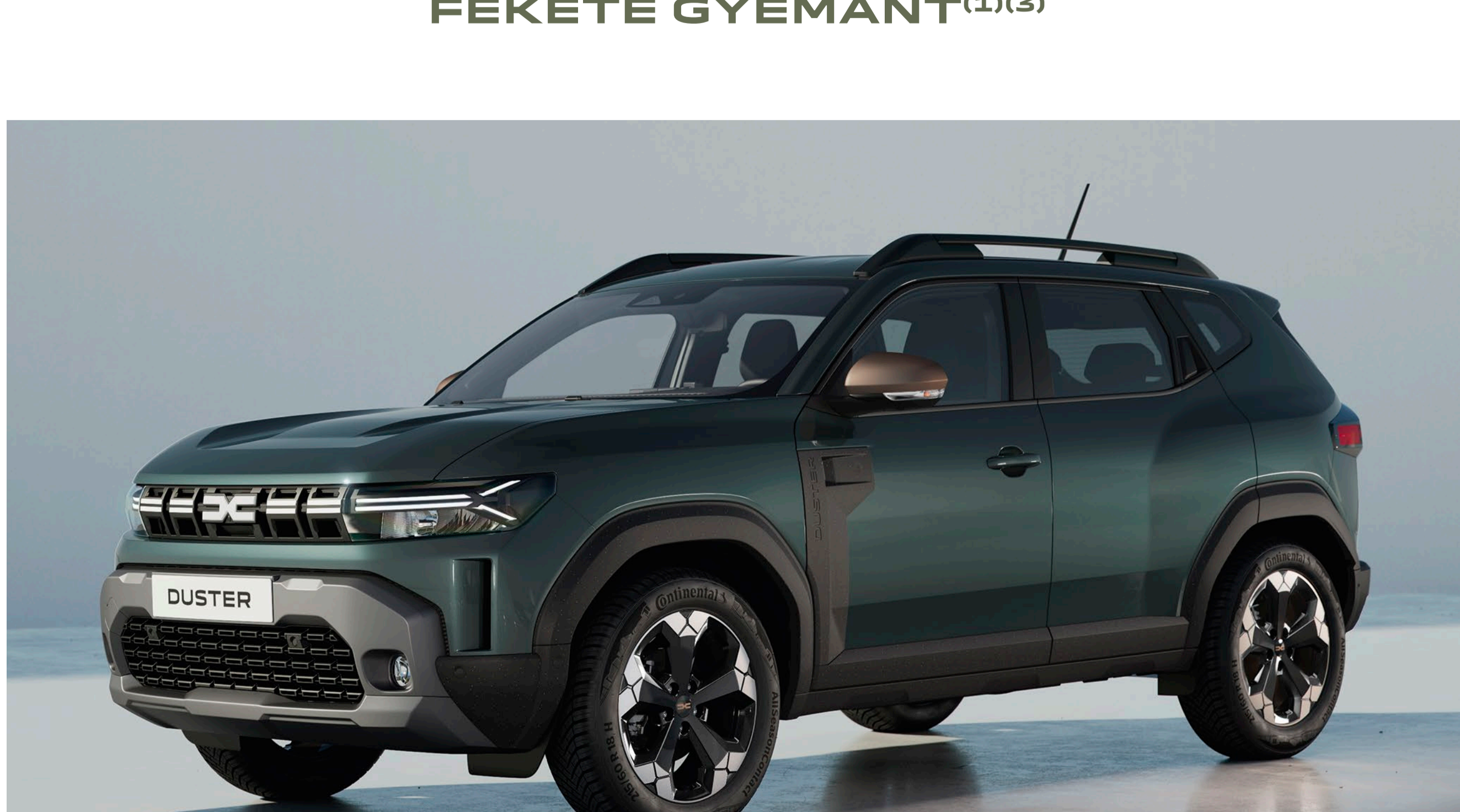
CÉDRUS ZÖLD (1)(3)