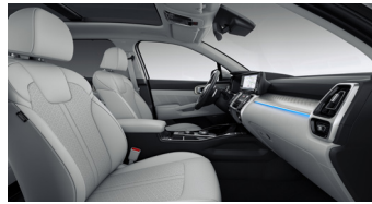
PLATINUM opciós szürke bőr