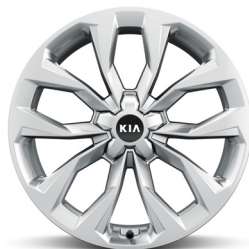
Dízél 20" könnyűfém keréktárcsa