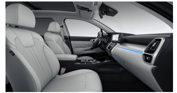
KRYPTONITE felár nélkül választható szürke bőr