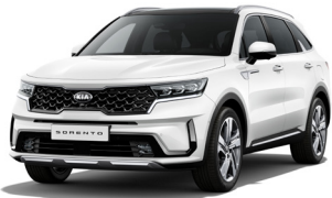
Snow White Pearl (SWP) PRÉMIUM METÁL