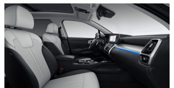
KRYPTONITE opciós fekete/szürke kéttónusú bőr