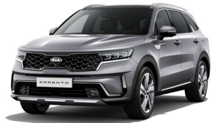
Steel Grey (KLG) METÁL