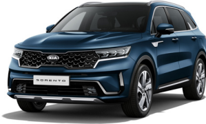
Gravity Blue (B4U) PRÉMIUM METÁL