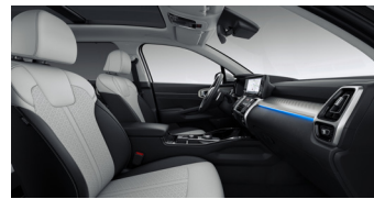
PLATINUM PRO opciós fekete/szürke kéttónusú bőr