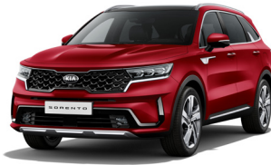
Runway Red (CR5) PRÉMIUM METÁL