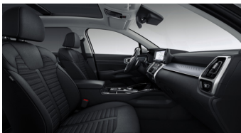
GOLD, PLATINUM, PLATINUM PRO sztenderd fekete szövet