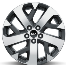
Dízél 18" könnyűfém keréktárcsa