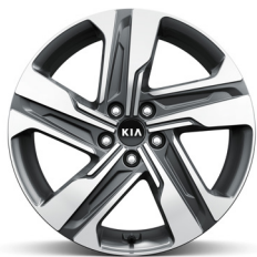
Dízél / HEV / PHEV 19" könnyűfém keréktárcsa