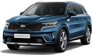
Mineral Blue (M4B) PRÉMIUM METÁL