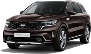
Essence Brown (BE2) PRÉMIUM METÁL