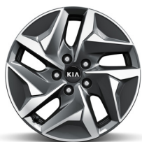
HEV 17" könnyűfém keréktárcsa