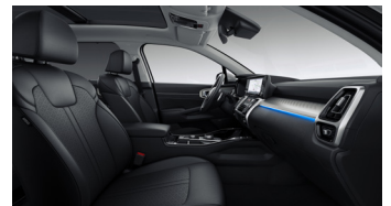
KRYPTONITE felár nélkül választható fekete bőr