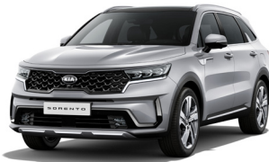
Silky Silver (4SS) METÁL