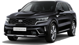
Aurora Black Pearl (ABP) METÁL