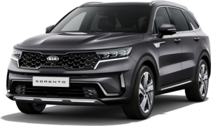
Platinum Graphite (ABT) METÁL