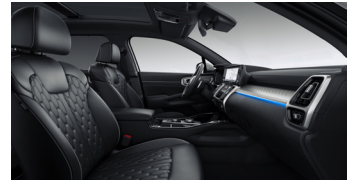
KRYPTONITE opciós fekete NAPPA bőr