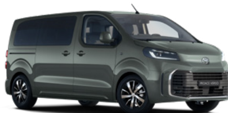
EDU Terepzöld Metálfényezés Bruttó 280 000 Ft

A karosszéria színe a felszereltségi szinttől is függhet.