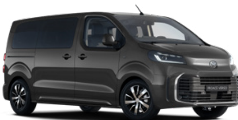
KKJ Titánszürke Metálfényezés Bruttó 280 000 Ft