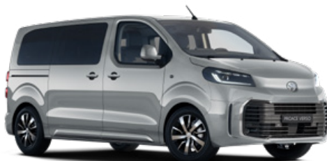
KCA Ezüst Metálfényezés Bruttó 280 000 Ft