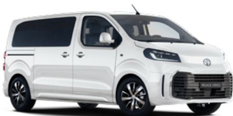
EPR Hófehér felár nélkül