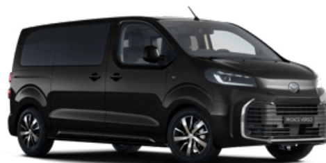
KTV Éjfékete Metálfényezés Bruttó 280 000 Ft