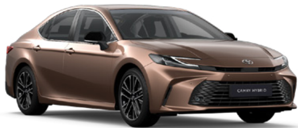
4Y6 Bronz Egyedi 350 000 Ft