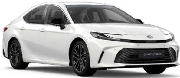
040 Hófehér Alapszín felár nélkül