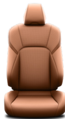
Barna bőr ülésborítás Alapfelszereltség a Prestige és Executive felszereltségnél