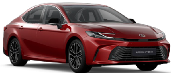
3U9 Érzéki vörös Egyedi 350 000 Ft