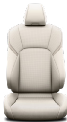
Törtfehér bőr ülésborítás Alapfelszereltség a Prestige és Executive felszereltségnél