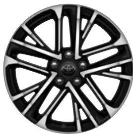
18" csiszolt hatású könnyűfém keréktárcsák 235/45 R18 méretű gumiabroncsokkal Alapfelszereltség a Prestige és az Executive modellváltozatoknál