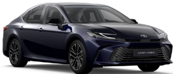
8X8 Sötétkék mica Metál 250 000 Ft