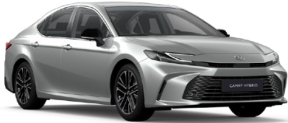
1F7 Ezüstmetál Metál 250 000 Ft