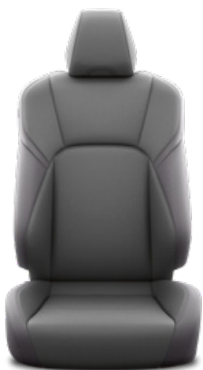
Fekete szövet ülésborítás Alapfelszereltség a Comfort modellváltozatnál