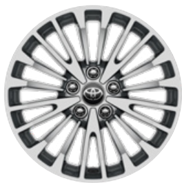
17" könnyűfém keréktárcsák 215/55 R17 gumiabroncsokkal Alapfelszereltség a Comfort modellváltozatnál