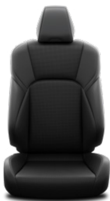
Fekete szintetikus bőr ülésborítás szövet betétekkel Alapfelszereltség a Comfort Business modellváltozatban