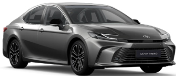
1L5 Sötétszürke metál Metál 250 000 Ft