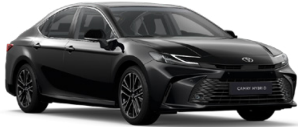
218 Fekete metál Metál 250 000 Ft