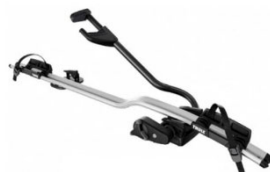
Expert 298 1-db-os kerékpártartó