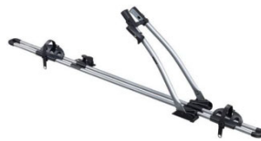
Freeride 532 1-db-os kerékpártartó