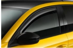
Szélterelő az első ablakokhoz