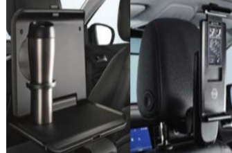
1 asztalka + 1 univerzális tablet tartó + 2 csatlakozó