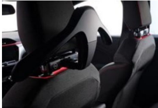
FlexConnect moduláris csatlakozó és vállfa