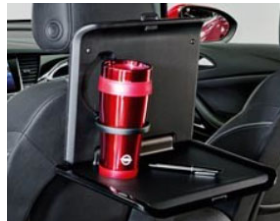
2 pohártartós asztalka 2 moduláris csatlakozó