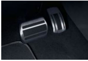
Rozsdamentes acél pedálborítás: 2 pedál (automata)