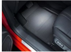
Négyévszakos szőnyeg garnitúra