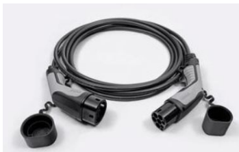
7,4 kW, 1 fázisú Type 2 kábel