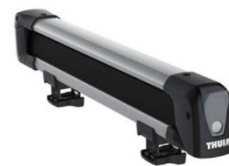
Snowpack 7324 tartó: 4 db síléc / 2 db snowboard