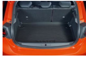
Csúszásgátló csomagterálca megemelt szegéllyel