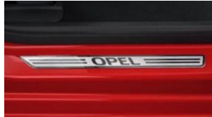
Első alumínium hatású Opel küszöbborítás