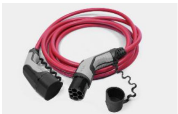
22 kW, 3 fázisú Type 2 kábel