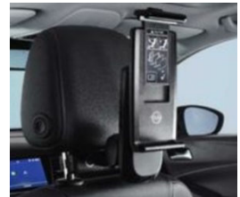
2 univerzális tablet tartó 2 moduláris csatlakozó