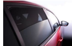
Hátsó és hátsó oldalsó árnyékoló szett