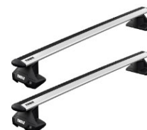
Corsa F-hez kereszt-irányú tetőrudak: