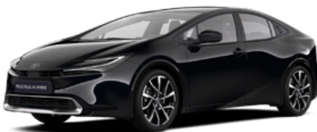
218 Fekete metál* 200000 Ft