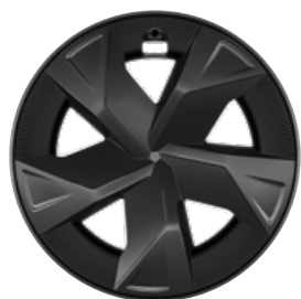
17" sötétszürke könnyűfém keréktárcsák aerodinamikai terelővel 195/60 R17 gumiabroncs Széria a Comfort szereltségnél