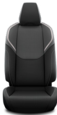
Fekete szövet ülésborítás Széria a Comfort és Prestige szereltségekben