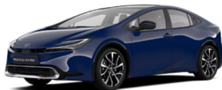
8Q4 Sötétkék felár nélkül