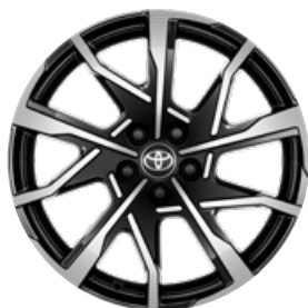
19" csiszolt hatású fekete könnyűfém keréktárcsák 195/50 R19 gumiabroncsokkal Széria a Prestige és Executive szereltségben