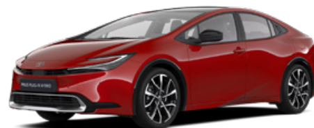
3U5 Érzéki Vörös 300000 Ft