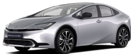
1L0 Palladium ezüst* 200000 Ft