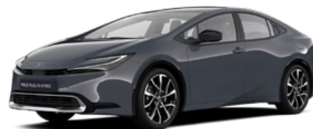
1M2 Hamu szürke* 300000 Ft