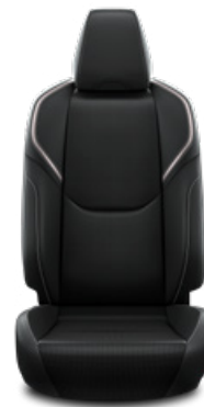
Fekete szintetikus bőr ülésborítás Széria az Executive szereltségben