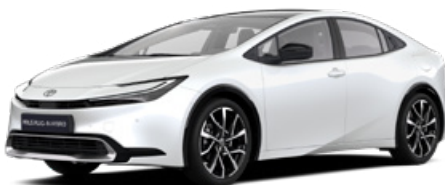
089 Gyöngy fehér 300000 Ft