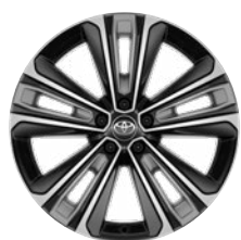
20" könnyűfém keréktárcsák, porvédő kupakkal