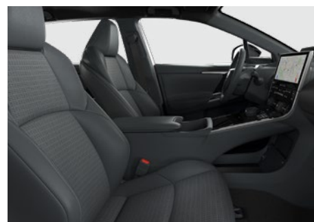
Bőr ülésborítás (szintetikus bőr) Alapfelszereltség: Executive