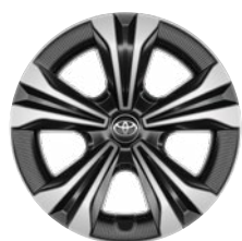
18" könnyűfém keréktárcsák, dísz tárcsával