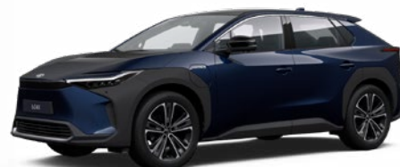
8S6 Mélytenger-kék S felár nélkül