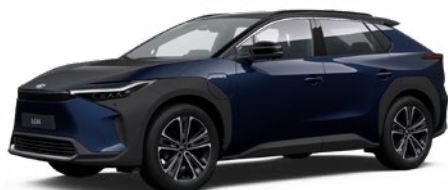
2MT Mélytenger-kék, fekete tetővel S felár nélkül Executive felszereltséghez rendelhető