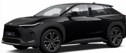
202 Asztrálfekete S felár nélkül