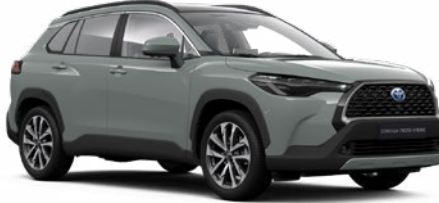
6X3 Oliva zöld* 190 000 Ft