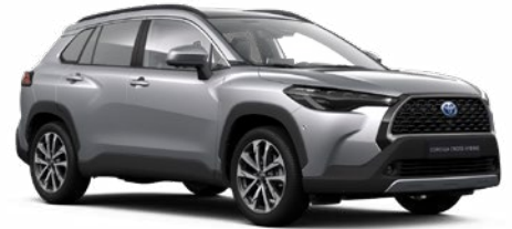
110 Palladium ezüst* 190 000 Ft