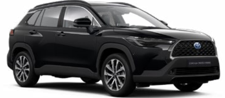
218 Attitude fekete 190 000 Ft