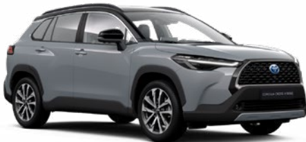
2YY Manhattan szürke fekete tetővel* felár nélkül Executive változathoz