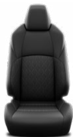
Fekete szövet ülésborítás Alapfelszereltség a Comfort, Style és Style Tech felszereltségnél