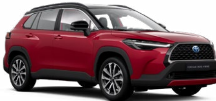
2YD Prémium vörös fekete tetővel* felár nélkül Executive változathoz