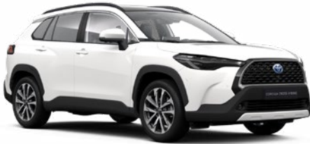
040 Hófehér felár nélkül