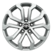
17" könnyűfém keréktárcsák 215/60 R17 Alapfelszereltség: Comfort