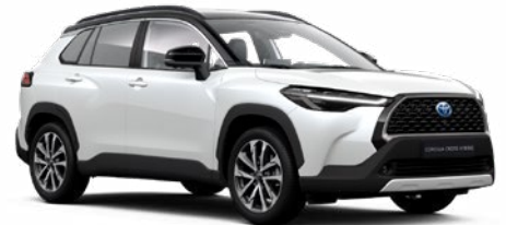
2PS Platina gyöngyfehér fekete tetővel* felár nélkül Executive változathoz