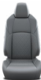
Szürke szövet ülésborítás Alapfelszereltség a Comfort, Style és Style Tech felszereltségnél