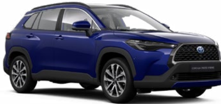
8W7 Kobaltkék* 190 000 Ft