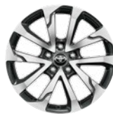
18" könnyűfém keréktárcsák 225/50 R18 Alapfelszereltség: Style és Executive