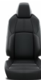
Fekete bőr ülésborítás Alapfelszereltség az Executive felszereltségnél