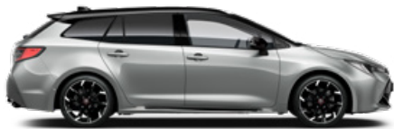
2TX GR SPORT Prémium ezüst/ Fekete tető Elérhető a GR SPORT felszereltségeken