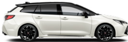
2PU GR SPORT Fehér/ Fekete tető Elérhető a GR SPORT felszereltségeken