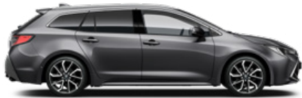
1G3 Szürke metál* 200 000 Ft