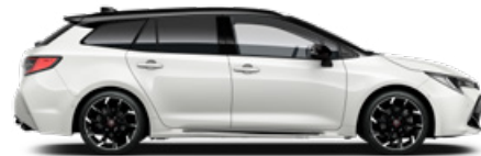
2NR GR SPORT Pure/ Fekete tető Elérhető a GR SPORT felszereltségeken