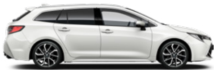
040 Hófehér felár nélkül