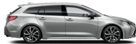
1L0 Palladium ezüst* 200 000 Ft