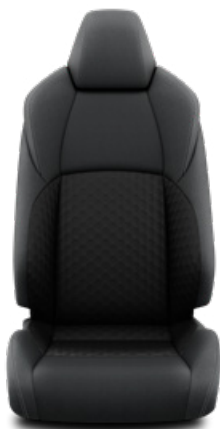
Fekete szövet ülésborítás Alapfelszereltség az Active felszereltségnél