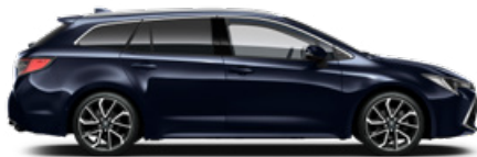
8X8 Sötétkék mica* 200 000 Ft