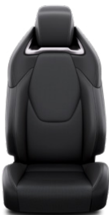
Bőr ülésborítás, fekete Alapfelszereltség az Executive és Hybrid Executive felszereltségnél