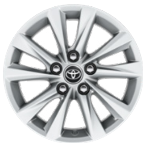
16" könnyűfém keréktárcsák 205/55 R16 gumiabronccsal Alapfelszereltség: Comfort és Comfort + Tech