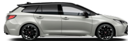
2RZ GR SPORT Higanyszürke/ Fekete tető Elérhető a GR SPORT felszereltségeken