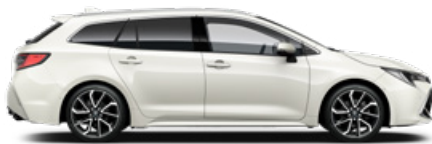
089 Platina gyöngy 300 000 Ft