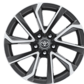
18" könnyűfém keréktárcsák 225/40 R18 gumiabroncsok Alapfelszereltség: Executive