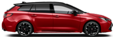
2SZ GR SPORT Passion/ Fekete tető Elérhető a GR SPORT felszereltségeken