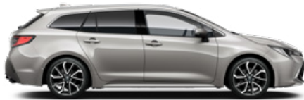
1J6 Krómezüst o 300 000 Ft