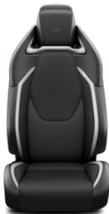
Sötétszürke szövet és szintetikus bőr ülésborítás GR Sport logoval Alapfelszereltség a GR Sport és GR SPORT Dynamic felszereltségnél