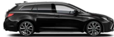
209 Éjfekete* 200 000 Ft