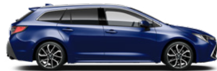
8Y8 Boróka metál* 200 000 Ft