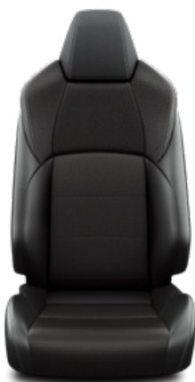
Fekete szövet ülésborítás steppelt fekete betétekkel Alapfelszereltség a Comfort, Comfort Tech és Comfort Style Tech felszereltségnél