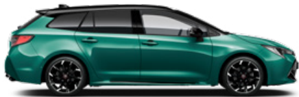
M28 Racing green / Fekete tető különleges fényezés Elérhető a GR SPORT felszereltségeken