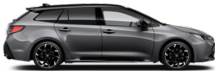
2MB GR SPORT Szürke metál/ Fekete tető Elérhető a GR SPORT felszereltségeken