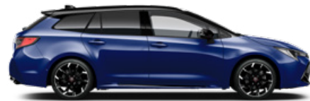
2VL GR SPORT Boróka metál/ Fekete tető Elérhető a GR SPORT felszereltségeken