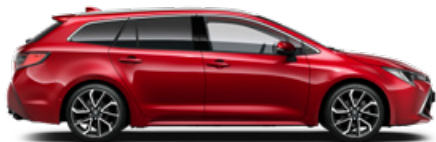
3U5 Érzéki vörös* 300 000 Ft