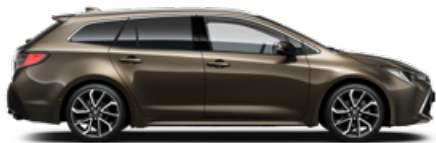
6X1 Barnászöld** 200 000 Ft