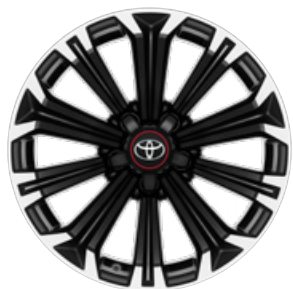
17" könnyűfém keréktárcsák 225/45 R17 gumiabroncsok Alapfelszereltség: GR SPORT