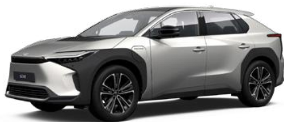
1J6 Krómezüst SS P 120 000 Ft