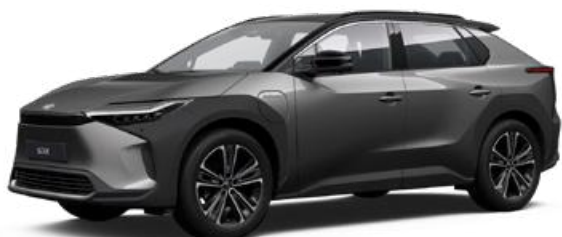
2VC Nikkelezüst, fekete tetővel SS P 120 000 Ft Executive felszereltséghez rendelhető