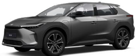
1L5 Nikkelezüst SS P 120 000 Ft