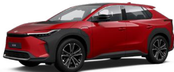
3U5 Érzéki vörös SS P 120 000 Ft