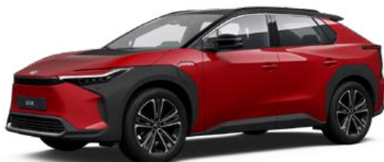
2TB Érzéki vörös, fekete tetővel SS P 120 000 Ft Executive felszereltséghez rendelhető