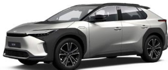
2MR Krómezüst, fekete tetővel SS P 120 000 Ft Executive felszereltséghez rendelhető