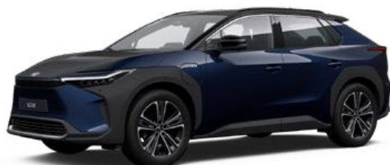
2MT Mélytenger-kék, fekete tetővel S felár nélkül Executive felszereltséghez rendelhető