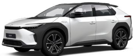
2VP Platina gyöngyfehér, fekete tetővel SS P 120 000 Ft Executive felszereltséghez rendelhető