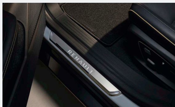
226 990 Ft

4 A feltüntetett árak az RN Hungary Kft. ajánlott árai, a tartozékok és tartozék csomagok beszerelési munkadíjáról érdeklődjön a Renault márkakereskedésekben!