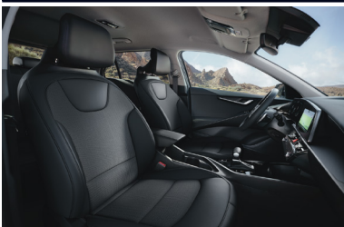
SILVER fekete szövet kárpit (sztenderd)