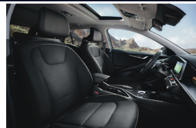
KRYPTONITE fekete szintetikus bőr kárpit (sztenderd választható)