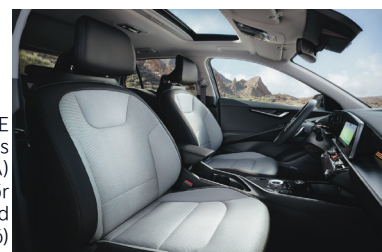
KRYPTONITE világos (színkód GRA) szintetikus bőr kárpit (sztenderd választható)