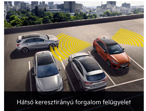
Hátsó keresztirányú forgalom felügyelet