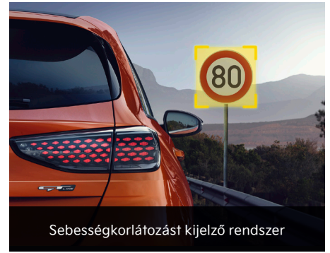
Sebességkorlátozást kijelző rendszer