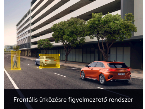
Frontális ütközésre figyelmeztető rendszer