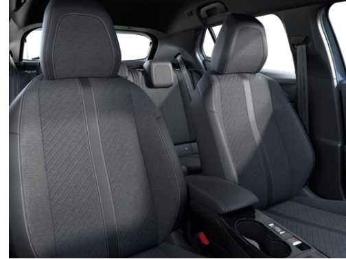
LOMSA szövetkárpit 'quartz' díszvarrással Allure széria