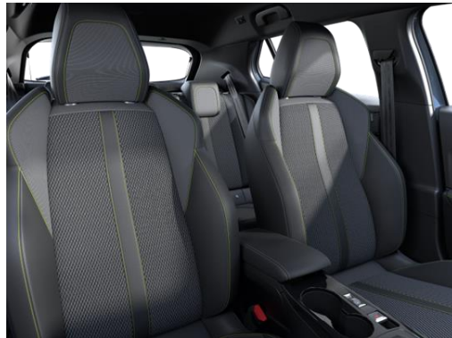
BELOMKA bőr-szövetkárpit 'adamite' díszvarrással GT széria