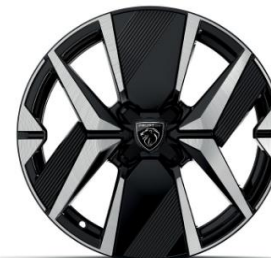
17" YANAKA GT széria