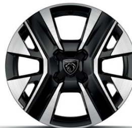
16" NOMA Allure széria