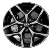
Könnnyűfém keréktárcsa 17" PLATINUM