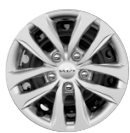
Acél keréktárcsa 15" SILVER