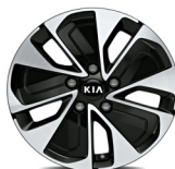
Könnnyűfém keréktárcsa 16" GOLD PLUS csomaghoz