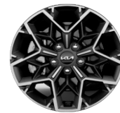
Könnnyűfém keréktárcsa 17" PLATINUM GT LINE GOLD SPORT