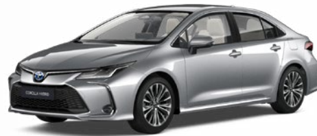
1L0 Palladium ezüst* 200 000 Ft