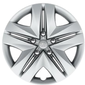
15" acél keréktárcsák díztárcsával (8 küllős) Alapfelszereltség az Active, Hybrid Active felszereltségnél