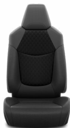
Fekete szövet ülésborítás steppelt fekete betétekkel Alapfelszereltség a Comfort, Comfort Tech és Comfort Style Tech felszereltségnél