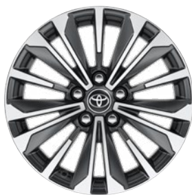
17" kéttónusú fekete, csiszolt hatású könnyűfém keréktárcsák Alapfelszereltség a Comfort Style, Hybrid Comfort Style felszereltségnél