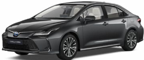
1G3 Szürke metál 200 000 Ft