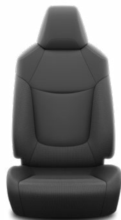
Fekete szövet ülésborítás Alapfelszereltség az Active felszereltségnél