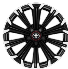
17" GR SPORT könnyűfém keréktárcsák (10 küllős) Alapfelszereltség a GR SPORT felszereltségnél