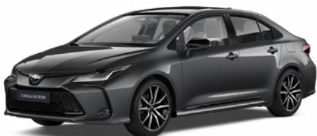
2NB GR-S szürke metál felár nélkül – GR SPORT