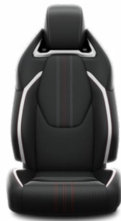
Sötétszürke szövet és szintetikus bőr ülésborítás GR SPORT logoval Alapfelszereltség a GR SPORT és GR SPORT Dynamic felszereltségnél