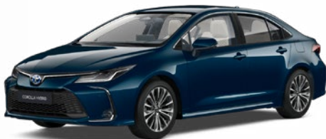
785 Tealevél mély zöld* 300 000 Ft