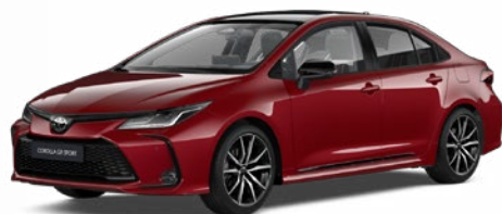
2TB GR-S érzéki vörös felár nélkül – GR SPORT