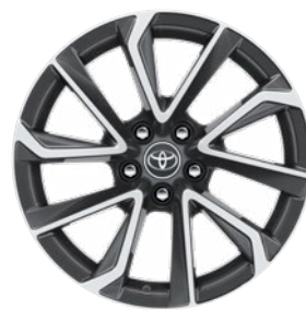
18" kéttónusú, szürke, csiszolt hatású könnyűfém keréktárcsák (5 dupla küllős) Executive Navi szereltségnél széria.