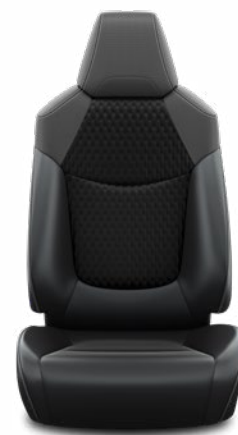
Fekete szövet ülésborítás bőr részekkel és steppelt betétekkel, bézs varrással Alapfelszereltség Hybrid Executive felszereltségnél