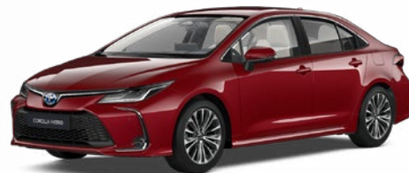
3U5 Érzéki vörös* 300 000 Ft