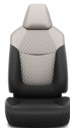
Szürke szövet ülésborítás steppelt világosszürke betétekkel Alapfelszereltség a Comfort, Comfort Tech és Comfort Style Tech felszereltségnél