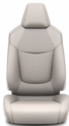
Világosszürke szövet ülésborítás bőr részekkel és steppelt szürke betétekkel, szürke varrással Alapfelszereltség Hybrid Executive felszereltségnél