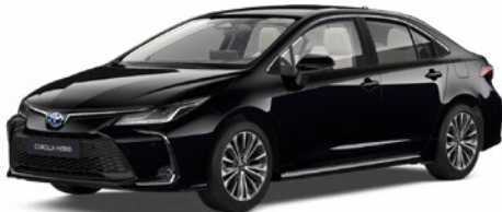
209 Éjfékete* 200 000 Ft