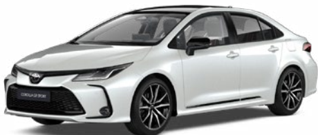
2VP GR-S gyöngyfehér felár nélkül – GR SPORT