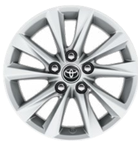
16" könnyűfém keréktárcsák (5 duplaküllös) Alapfelszereltség a Comfort és Hybrid Comfort felszereltségnél