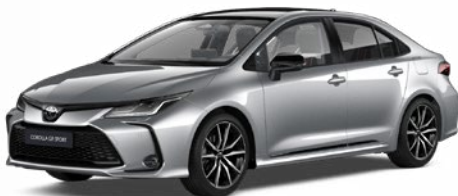
2VU GR-S prémium ezüst felár nélkül – GR SPORT