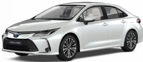
089 Platina gyöngyfehér** 300 000 Ft