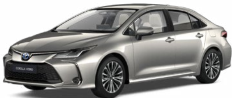
1J6 Krómezüst* 300 000 Ft