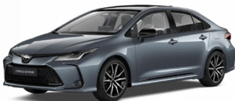
2TH GR-S szürkéskék felár nélkül – GR SPORT