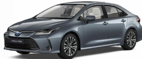
1K3 Szürkéskék metál* 200 000 Ft