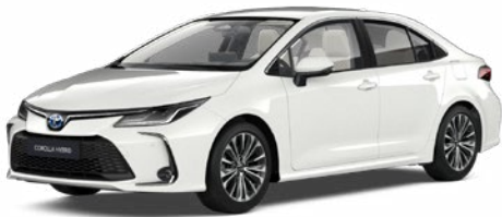
040 Hófehér felár nélkül