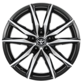
18" csiszolt hatású könnyűfém keréktárcsák (10 küllős) Alapfelszereltség a GR SPORT Dynamic felszereltségnél