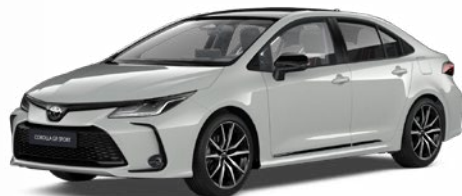
2VF GR-S hamuszürke felár nélkül – GR SPORT