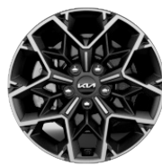
Könnyűfém keréktárcsa 17"