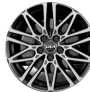
Könnyűfém keréktárcsa 18"