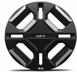
19" keréktárcsa (XP)