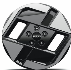
17" keréktárcsa (VA)