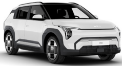
Clear White (UD) alapfényezés