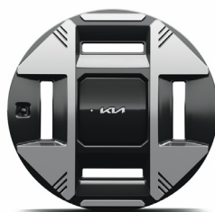
19" keréktárcsa (XM)