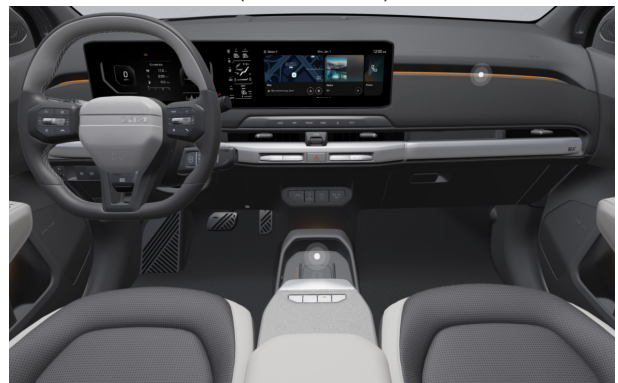
GT-LINE - sztenderd törtfehér-szürke vegán bőr üléskárpit - DFS