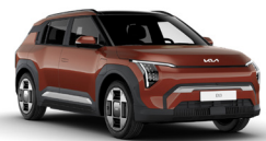
Terra Cotta (TCT)