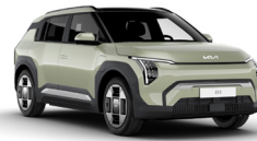
Aventurine Green (AG3)