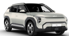
Ivory Silver (ISM) Matt fényezés