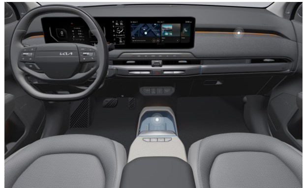
EARTH PLUS - sztenderd szürke 2tone vegán bőr üléskárpit - ELG (Blue díszbetéttel)