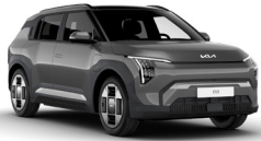
Shale Grey (EBD)