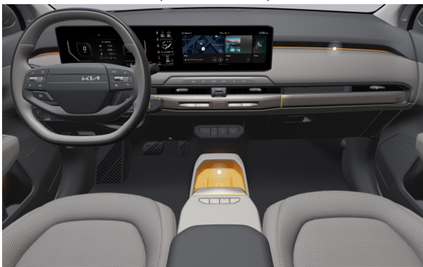
EARTH PLUS - opciós világos szürke 2tone vegán bőr üléskárpit - (Orange díszbetéttel) EWR