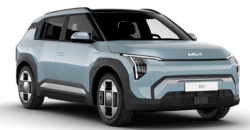
Frost Blue (EBB)