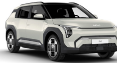
Ivory Silver (ISG)