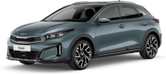
Yuca Steel Gray (USG) GT-Linehoz nem elérhető