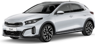
Cassa White (WD)