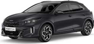
Penta Metal (H8G)