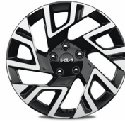
18" könnyűfém keréktárcsa (X-GOLD, X-PLATINUM)