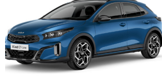
Blue Flame (B3L)