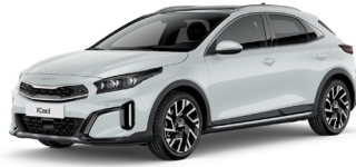
Deluxe White (HW2)