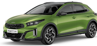
Celadon Spirit Green (CE6)