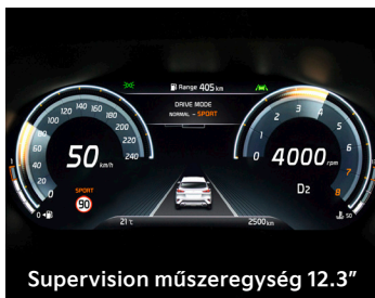
Supervision műszeregység 12.3"