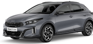
Lunar Silver (CSS)