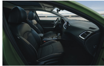
Választható szintetikus bőr/textil kárpitozás X-GOLD és X-PLATINUM felszereltséghez (CPB fehér varrással) Választható szintetikus bőr/textil kárpitozás X-GOLD és X-PLATINUM felszereltséghez (CPK kék varrással)