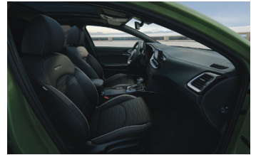
Sportos szintetikus bőr/szövet ülések GT-Line felszereltséghez