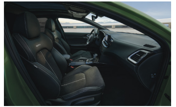
Opcionális BŐR csomag Suede kárpitozással GT-Line felszereltséghez