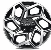
18" könnyűfém keréktárcsa (GT-LINE)