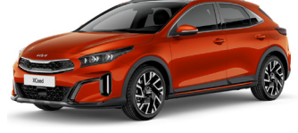
Orange Fusion (RNG) (már csak készletről elérhető)