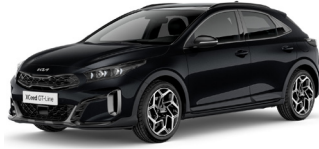
Black Pearl (1K)