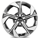
16" könnyűfém keréktárcsa (X-SILVER)