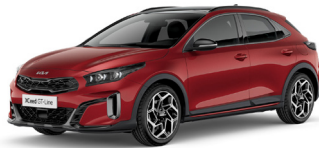
Infra Red (AA9)