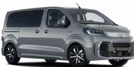
KKJ Titánszürke Metálfényezés Bruttó 280 000 Ft