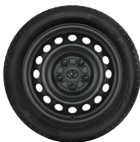
Komplett téli szerelt kerék szett (4db)

Téli szerelt kerék 16" TMEWS00038DY 215/65R16C 109/107T Bridgestone W810 acélfelnivel