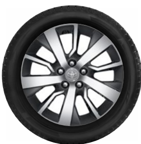
Komplett téli szerelt kerék szett (4db)

Téli szerelt kerék 17" TMEWA00138UY 215/60R17 109T Falken EWNVN01 alufelnivel