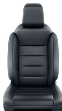
Fekete bőr Alapfelszereltség VIP modelleken