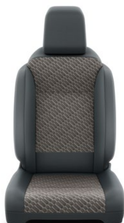
Fekete szövet barna betétekkel Alapfelszereltség Family modelleken