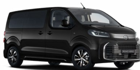
KTV Éjfékete Metálfényezés Bruttó 280 000 Ft