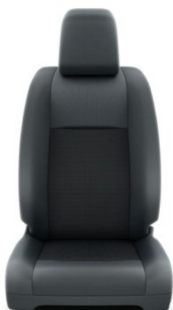
Fekete szövet ülésborítás Alapfelszereltség Combi és Business modelleken