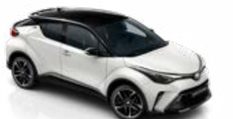
2MQ Hófehér / fekete tető csak a GR SPORT változatban rendelhető