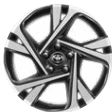
18" fekete, csiszolt hatású könnyűfém keréktárcsa (5 dupla küllős) Széria a Style modellváltozatokon