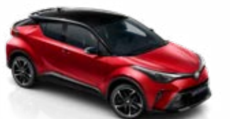
2TB Érzéki vörös / fekete tető különleges fényezés csak a GR SPORT változatban rendelhető