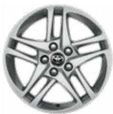
17" ezüstszerű könnyűfém keréktárcsa (5 dupla küllős) Széria a Comfort modellváltozaton