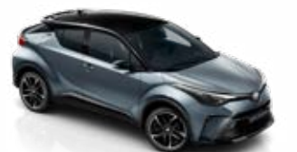
2TH Szürkéskék / fekete tető metálfényezés csak a GR SPORT változatban rendelhető