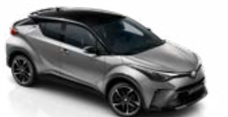
2VU Prémiumezüst / fekete tető különleges fényezés csak a GR SPORT változatban rendelhető