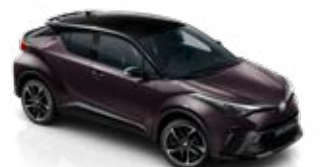
2XE Mély ametisztlila / fekete tető metálfényezés csak a GR SPORT változatban rendelhető