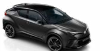
2NB Hamuszürke / fekete tető metálfényezés csak a GR SPORT változatban rendelhető