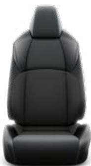
Fekete & sötétszürke szövet ülésborítás bőr betétekkel Széria a Style modellváltozaton