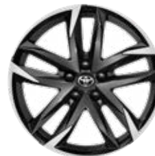
19" GR SPORT könnyűfém keréktárcsa (10 dupla küllős) Széria a GR SPORT modellváltozaton