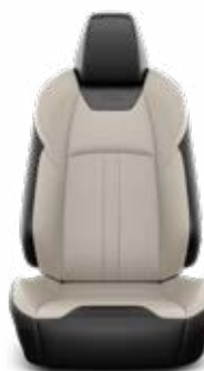
Grézs színű bőr kárpit Széria az Executive VIP modellváltozaton