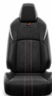
Fekete Alcantara kárpit, bőr betétekkel, szaténkróm színű díszcsikkel Széria a GR SPORT modellváltozaton