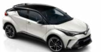
2VP Platina gyöngyfehér / fekete tető gyöngyház fényezés csak a GR SPORT változatban rendelhető