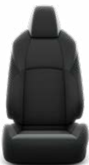
Fekete szövetkárpit, világosszürke varrással Széria a Comfort modellváltozaton