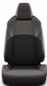
Orchidea-mintás steppelt szövetkárpit, bőr betétekkel Széria az Executive modellváltozaton