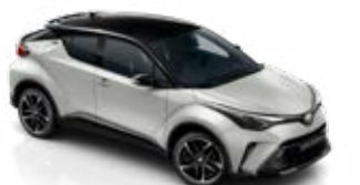
2VF Nikkelszürke / fekete tető metálfényezés csak a GR SPORT változatban rendelhető