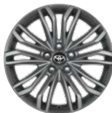
18" ezüst színű könnyűfém keréktárcsa (10 dupla küllős) Széria az Executive modellváltozaton