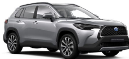
110 Palladium ezüst* 200 000 Ft