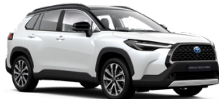
2PS Platina gyöngyfehér fekete tetővel* felár nélkül Executive változathoz