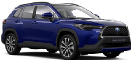
8W7 Kobaltkék* 200 000 Ft