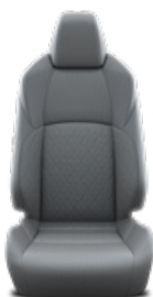
Szürke szövet ülésborítás Alapfelszereltség a Comfort, Style és Style Tech felszereltségnél