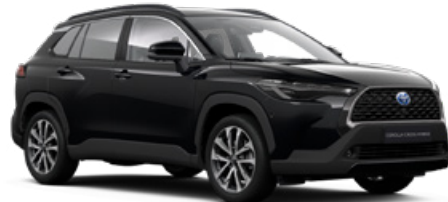
218 Attitude fekete 200 000 Ft