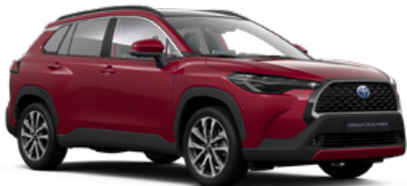
3T3 Prémium vörös** 300 000 Ft