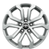
17" könnyűfém keréktárcsák 215/60 R17 Alapfelszereltség: Comfort