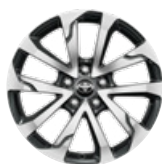
18" könnyűfém keréktárcsák 225/50 R18 Alapfelszereltség: Style és Executive