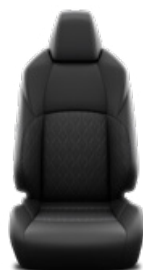
Fekete szövet ülésborítás Alapfelszereltség a Comfort, Style és Style Tech felszereltségnél