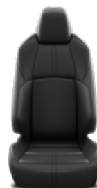
Fekete bőr ülésborítás Alapfelszereltség az Executive felszereltségnél