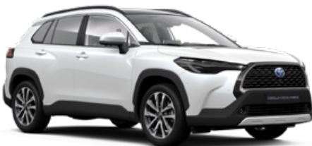
089 Platina gyöngyfehér** 300 000 Ft