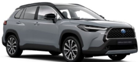
2YY Manhattan szürke fekete tetővel* felár nélkül Executive változathoz