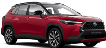
2YD Prémium vörös fekete tetővel* felár nélkül Executive változathoz