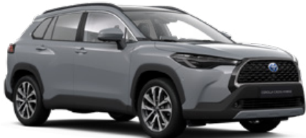
1H5 Manhattan szürke* 200 000 Ft