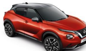
Piros / Ezüst XEZ – 300 000 Ft