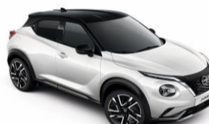
Fehér / Fekete XKJ – 300 000 Ft