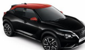
Fekete / Piros YAX – 300 000 Ft