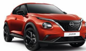
Naplemente vörös NBV – 160 000 Ft