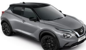
Szürke / Fekete XEX – 300 000 Ft