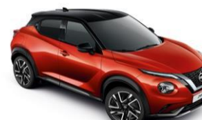
Piros / Fekete YAU – 300 000 Ft