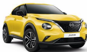
Sárga ECE – 160 000 Ft