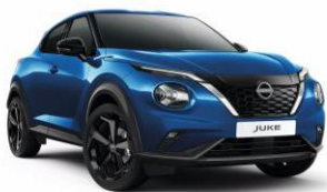
Élénkkek RCF – 160 000 Ft