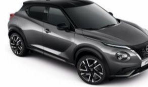
Szürke / Fekete GAQ – 300 000 Ft