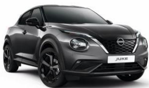
Szürke KAD – 160 000 Ft