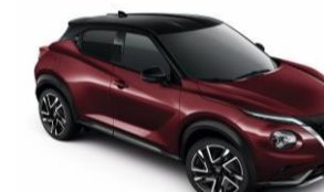
Burgundi / Fekete XDO – 300 000 Ft