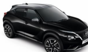
Fekete / Ezüst YAY – 300 000 Ft