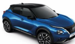
Élénkkek / Fekete XGZ – 300 000 Ft