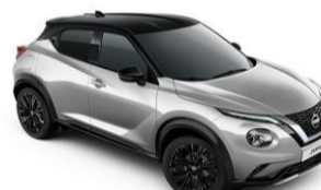
Ezüst / Fekete YAV – 300 000 Ft