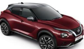
Burgundi / Ezüst XEE – 300 000 Ft