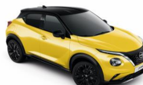
Sárga / Fekete YAS – 300 000 Ft