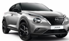
Ezüst KYO – 160 000 Ft