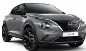
Gyöngyházsürke KBY – 160 000 Ft