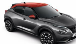
Szürke / Piros XFB – 300 000 Ft