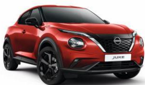
Piros Z10 – 0 Ft