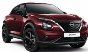
Burgundi NBQ – 160 000 Ft