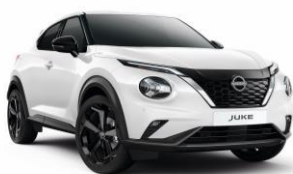
Fehér 326 – 70 000 Ft