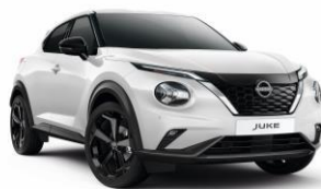
Gyöngyházfehér QBE – 190 000 Ft