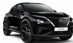
Gyöngyházfekete GAT – 160 000 Ft