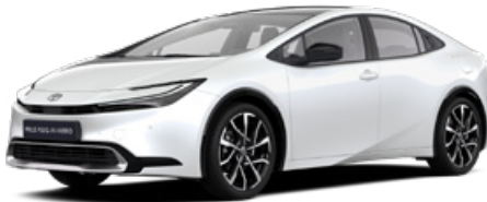
089 Gyöngy fehér 300 000 Ft