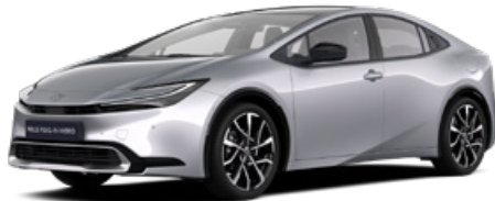
1L0 Palladium ezüst* 200 000 Ft