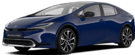
8Q4 Sötétkék felár nélkül