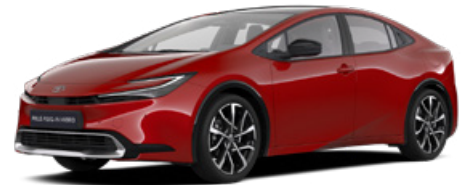
3U5 Érzéki Vörös 300 000 Ft