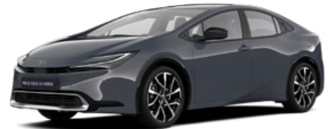
1M2 Hamu szürke* 300 000 Ft