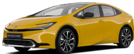
5C5 Mustársárga metál* 200 000 Ft