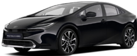
218 Fekete metál* 200 000 Ft