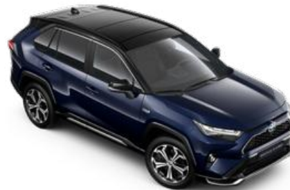
2RA Éjkék fekete tetővel* Selection Sapphire felár nélkül