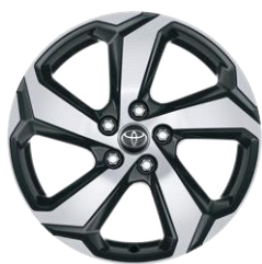
18" szürke, csiszolt felületű könnyűfém keréktárcsa (5 küllős) Alapfelszereltség a Dynamic modellváltozaton