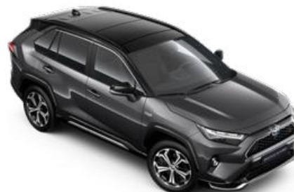
2QZ Hamuszürke fekete tetővel* Selection Graphite felár nélkül