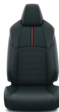
Fekete bőr Alapfelszereltség az Executive modellváltozaton