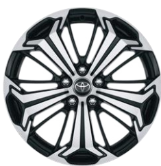
19" fekete, csiszolt felületű könnyűfém keréktárcsa (5 küllős) Alapfelszereltség a Selection és Executive modellváltozaton