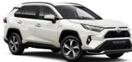
089 Platina gyöngyfehér** 310 000 Ft