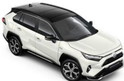
2PS Platina gyöngyfehér fekete tetővel** Selection Pure felár nélkül