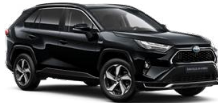
218 Fekete gyöngyház* 190 000 Ft