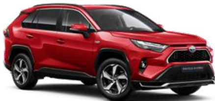
3U5 Érzéki vörös* 310 000 Ft