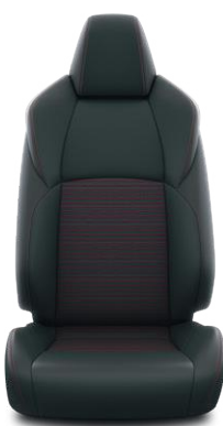
Fekete bőrhatású Alapfelszereltség a Selection modellváltozaton