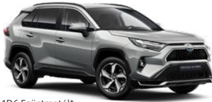
1D6 Ezüstmetál* 190 000 Ft