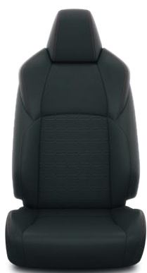
Fekete szövet Alapfelszereltség a Dynamic modellváltozaton