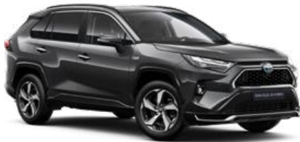
1G3 Hamuszürke* 190 000 Ft