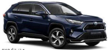
8X8 Éjkék* 190 000 Ft