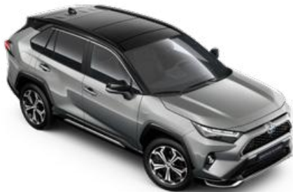
2QY Ezüstmetál fekete tetővel* Selection Platinum felár nélkül