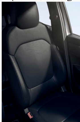
Fekete bőrhatású (TEP) kárpitozás szürke varrásokkal