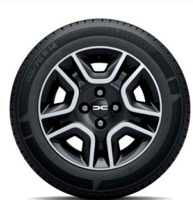
14" acél keréktárcsa DORIA dísz tárcsa (FlexWheel®) - fekete (fehér logo)