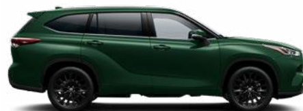
6X5 Ciprus zöld metál metálfényezés