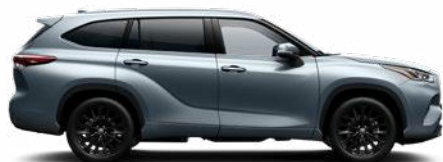
1K5 Holdfény prémium metálfényezés