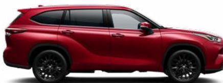
3T3 Vörös prémium metálfényezés