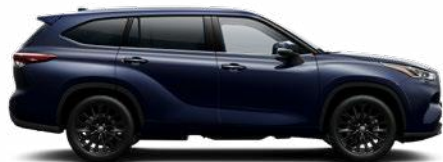
8X8 Sötétkék mica metálfényezés