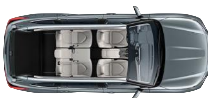
5 ülésel 865* liter