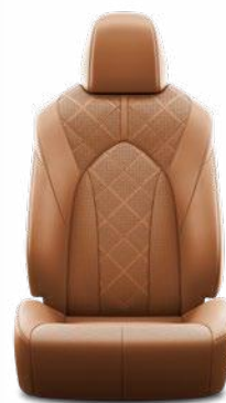
Okkersárga perforált bőr, gyémántmintázatú, fekete varrással Alapfelszereltség az Executive modellváltozaton