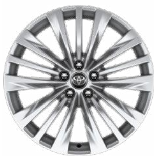
20" ezüstsínű könnyűfém felni 235/55 R20 gumiabronccsal Alapfelszereltség a Prestige modellváltozaton