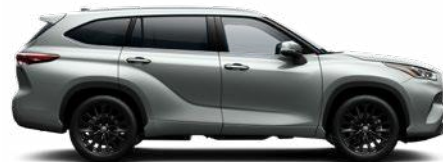
1J9 Ezüstmetál metálfényezés