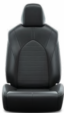
Bőrhátasú szövet Alapfelszereltség a Comfort modellváltozaton