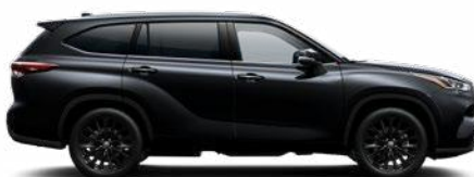
218 Fekete gyöngyház metálfényezés

A Highlander ügyfélárak tartalmazzák a metálfény felárat, a prémium fényezés felárat a Premium felszereltségek tartalmazza.