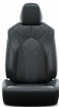
Fekete perforált bőr, gyémántmintázatú, fekete varrással Alapfelszereltség az Executive modellváltozaton