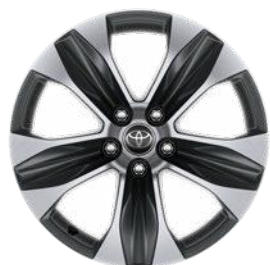
18" sötétszürke, csiszolt felületű könnyűfém felni (5 küllős) 235/65 R18 gumibronccsal Alapfelszereltség a Comfort modellváltozaton