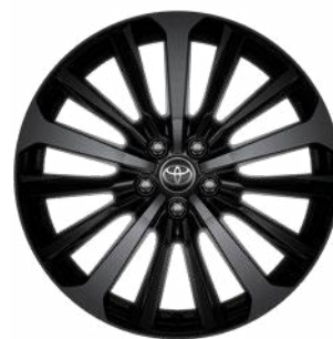
20" fekete könnyűfém felni 235/55 R20 gumiabronccsal Alapfelszereltség az Executive modellváltozaton