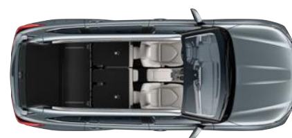
2 ülésel 1909* liter