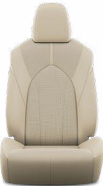
Bézs perforált bőr, steppelt, fekete varrással Alapfelszereltség a Prestige modellváltozaton