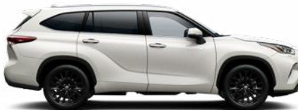
089 Platinagyöngy prémium gyöngyház fényezés