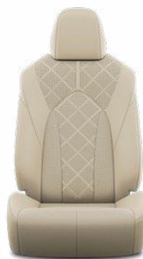
Bézs perforált bőr, gyémántmintázatú, fekete varrással Alapfelszereltség az Executive modellváltozaton