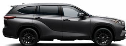
1G3 Hamuszürke metálfényezés