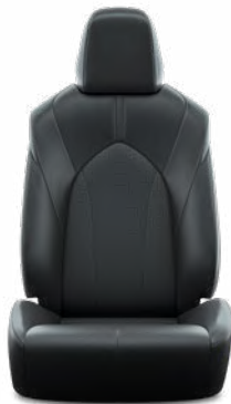
Fekete perforált bőr, steppelt, fekete varrással Alapfelszereltség a Prestige modellváltozaton