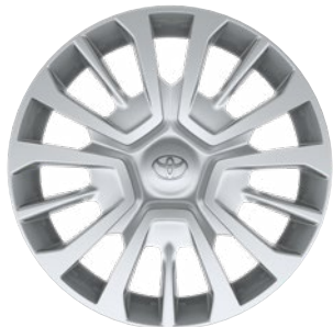
16" acél keréktárcsák díztárcsával