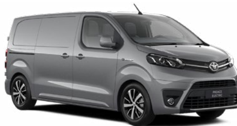
KCA Ezüst Metálfényezés, (nettó ár/bruttó ár): 160 000 Ft/203 200 Ft