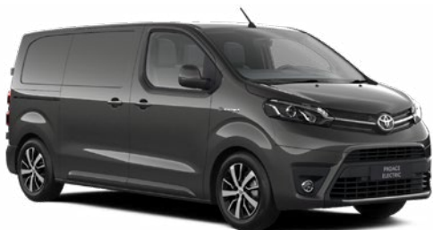
EVL Sóljomszürke Metálfényezés, (nettó ár/bruttó ár): 160 000 Ft/203 200 Ft