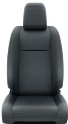
Szürke ülésborítás PVC kombinációval