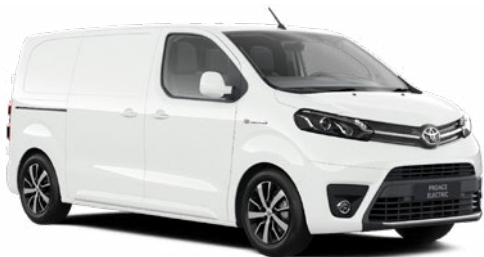
EPR Hófehér Felár nélkül