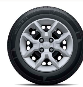
14" acél keréktárcsa BALBOA dísz tárcsa - ezüst