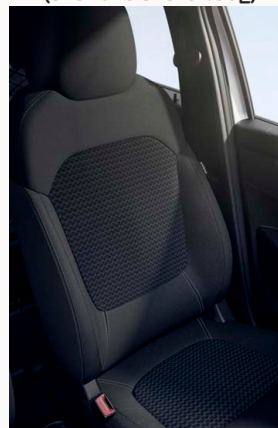
Szürke / szürke mintás textilkárpitozás szürke varrásokkal