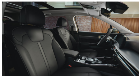
PLATINUM PRO, KRYPTONITE opcionális fekete bőr