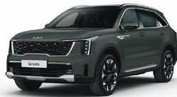
Cityscape Green (CGE) METÁL