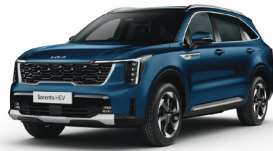
Mineral Blue (M4B) PRÉMIUM METÁL