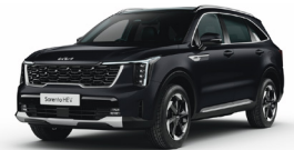
Aurora Black Pearl (ABP) METÁL