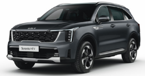
Interstellar Gray (AGT) PRÉMIUM METÁL