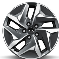
17" könnyűfém keréktárcsa (VB)