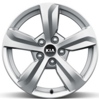
17" könnyűfém keréktárcsa (VA)