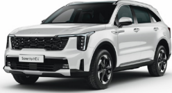
Snow White Pearl (SWP) PRÉMIUM METÁL