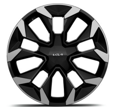
20" könnyűfém keréktárcsa (UV)