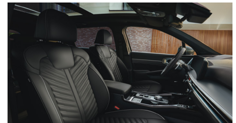
KRYPTONITE opcionális fekete Nappa bőr