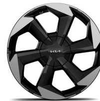
19" könnyűfém keréktárcsa (XM)