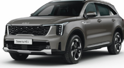
Volcanic Sand (BN4) PRÉMIUM METÁL