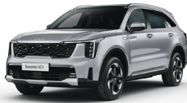
Silky Silver (4SS) METÁL