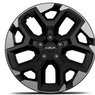
18" könnyűfém keréktárcsa (XK)