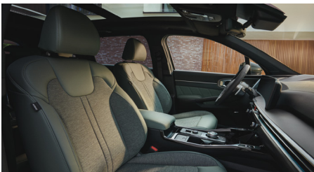
PLATINUM, PLATINUM PRO, KRYPTONITE sztenderd vegánbőr-szövet