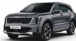
Steel Grey (KLG) METÁL