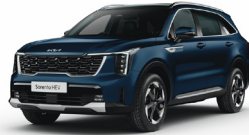
Gravity Blue (B4U) PRÉMIUM METÁL