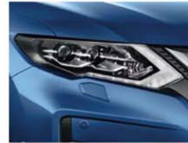
Élénk kék - PM - RAW