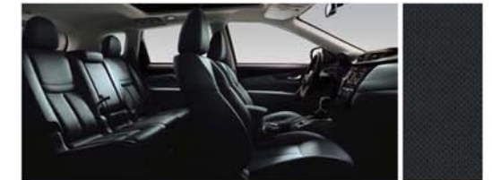
PERFORÁLT BŐR ÜLÉSEK - GRAFIT