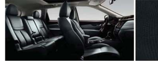
SZÖVET ÜLÉSKÁRPIT - GRAFIT