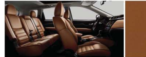
FEKETE BETÉTES ÜLÉSEK NATUR BŐR PÁRNÁZÁSSAL