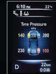
KERÉKNYOMÁS ELLENŐRZŐ RENDSZER