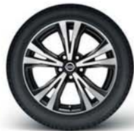
18"-os könnyűfém keréktárcsa