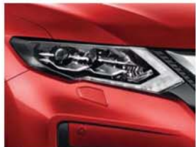
Sötétvörös - CP - NBF