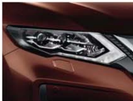
Gesztenyebarna - P - CAS