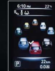
KIJELZŐ SZÍNÉNEK KIVÁLASZTÁSA