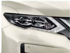
Gyöngyház fehér - 3P - QAB