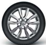
17"-os könnyűfém keréktárcsa (ezüst)