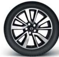
19"-os könnyűfém keréktárcsa