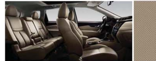
PERFORÁLT BŐR ÜLÉSEK - BÉZS