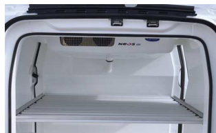
Lehajtható polc az oldalfalon (jobb oldali tolóajtó esetén)