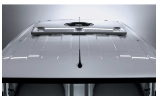
Diavia Rolle 2000 hűtőegység (-10°C)