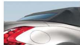
FEKETE TETŐ fekete textil, szürke bőr vagy fekete bőr kivitelben