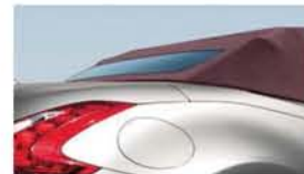
BORDÓ TETŐ bordó bőr kivitelben

Az általános iparági gyakorlatnak megfelelően, a bőrtülések egyes részei műbőrből készülhetnek. Ezen anyag használatával az ülés tartósságának a növelése a cél, mivel az alkalmazott műbőr ellenállóbb a karcolódással szemben, könnyebben tisztítható és nem ráncosodik az idő múlásával.