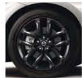
ÚJ 18"-os sötét fegyverszürke könnyűfém keréktárcsák