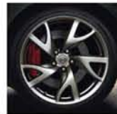
19"-os könnyűfém keréktárcsák