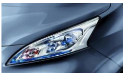
Szürke (M) K51