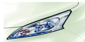
Gyöngyházfehér (GY) QAB