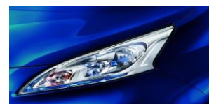
Kék (GY) BW9

● Alapfelszereltség, ○ Opció, - Nem elérhető (M) - metál, (Gy) - Gyöngyház