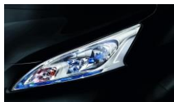
Fekete (M) GN0