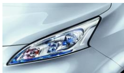
Ezüst (M) KL0