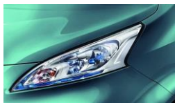
Türkizkék (M,Gy) RBM